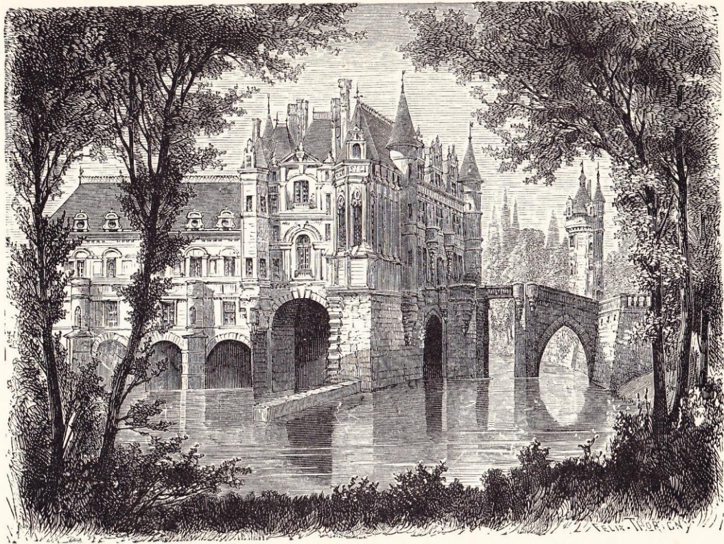
Château de Chenonceaux (1496-1555).

Parue précédemment au moins, à la page 145, dans Henri MARTIN , Histoire de France populaire depuis les temps les plus reculés jusqu'à nos jours (Paris, librairie Furne – Jouvet et Cie éditeurs, tome deuxième (1867 ?), 580 pages :