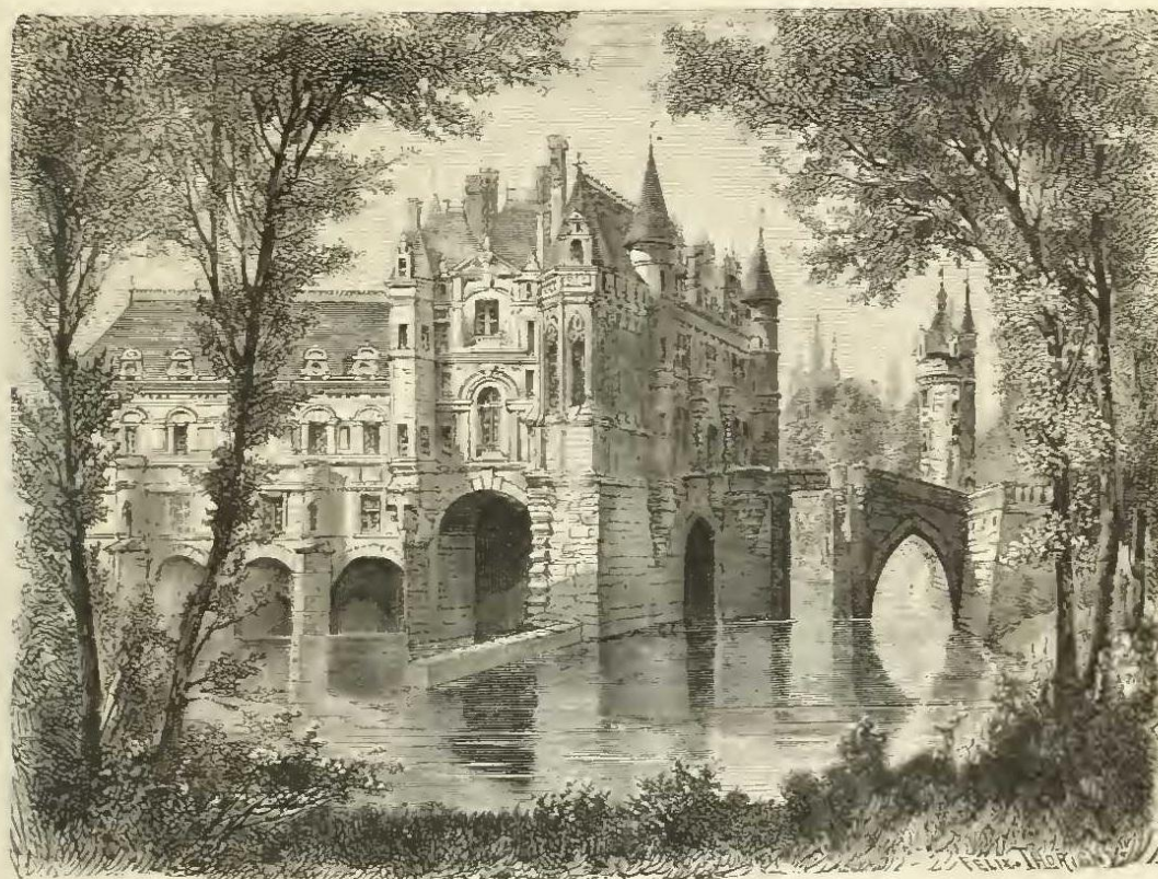
Château de Chenonceaux.

réclamées par l'assemblée, toutefois en diminuant quelque peu leur hardiesse et leur portée. Le Concordat était aboli. L'élection des chefs de l'Église était partagée entre le clergé, les ordres laïques et la couronne, qui devait choisir parmi trois candidats présentés par les ecclésiastiques et les laïques. De même, dans les élections judiciaires, le roi choisirait entre trois candidats présentés soit par les membres des parlements dans ces tribunaux supérieurs, soit par les gens de loi et les magistrats municipaux, dans les tribunaux inférieurs. Le paiement des annates et autres contributions au pape était interdit. Les prélats étaient tenus de résider dans leurs bénéfices. Des écoles gratuites devaient être fondées aux dépens de l'Église. On ne devait plus recevoir de prêtres avant trente ans. Il était défendu d'exiger de l'argent pour les sacrements.